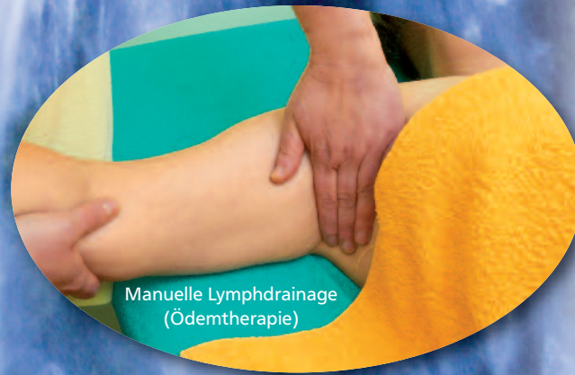
Manuelle Lymphdrainage (Ödemtherapie)